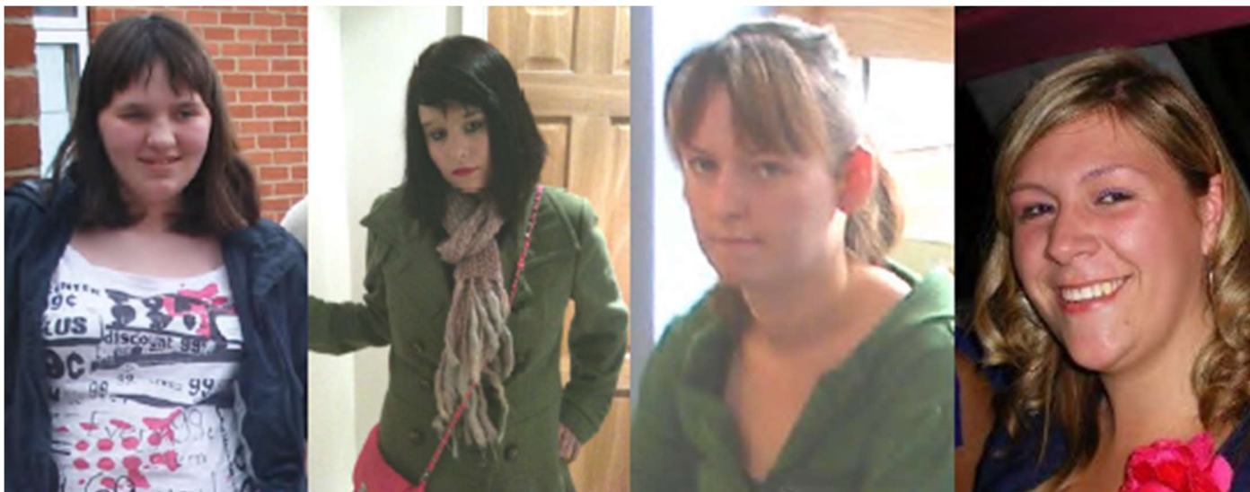
成長中：15 歲（左）；17 歲（中左）；18 歲（中右和右）